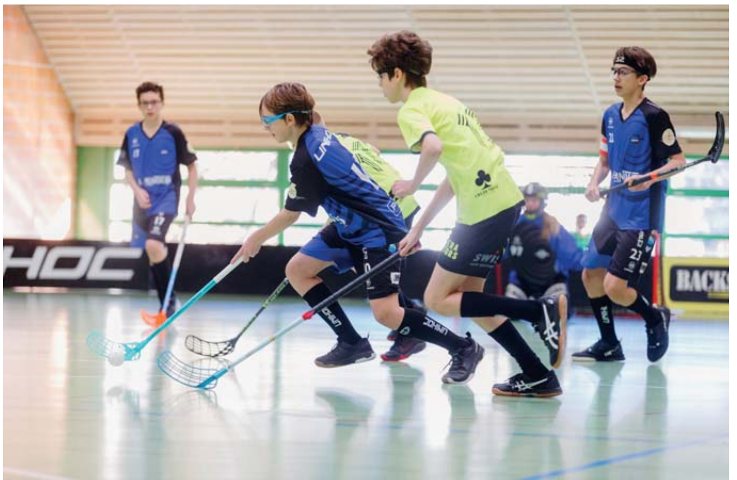
Les juniors C du UHC (en bleu) ont connu deux défaites, samedi, devant leurs supporters.

Avec, en prime, un certain succès en termes de résultats puisque les juniors B sont classés troisièmes, les C quatrièmes, alors que les D n'ont pas encore connu la défaite. «On a une bonne reconnaissance quand on se déplace aux jour-